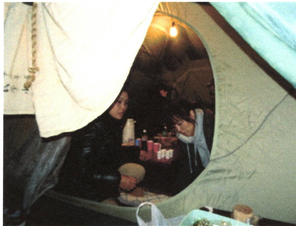
チョット中をのぞいて