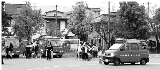
▲消防団積載車搭乗体験