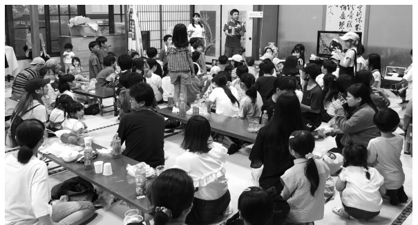
盛り上がった、じゃんけん大会