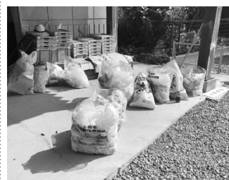
▲可燃物・不燃物も多いです