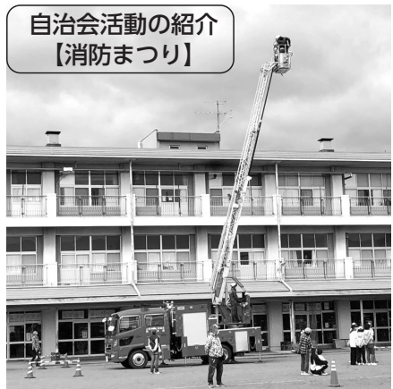
▲はしご車搭乗体験