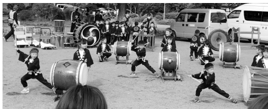
▲三好町保育園やまびこ太鼓